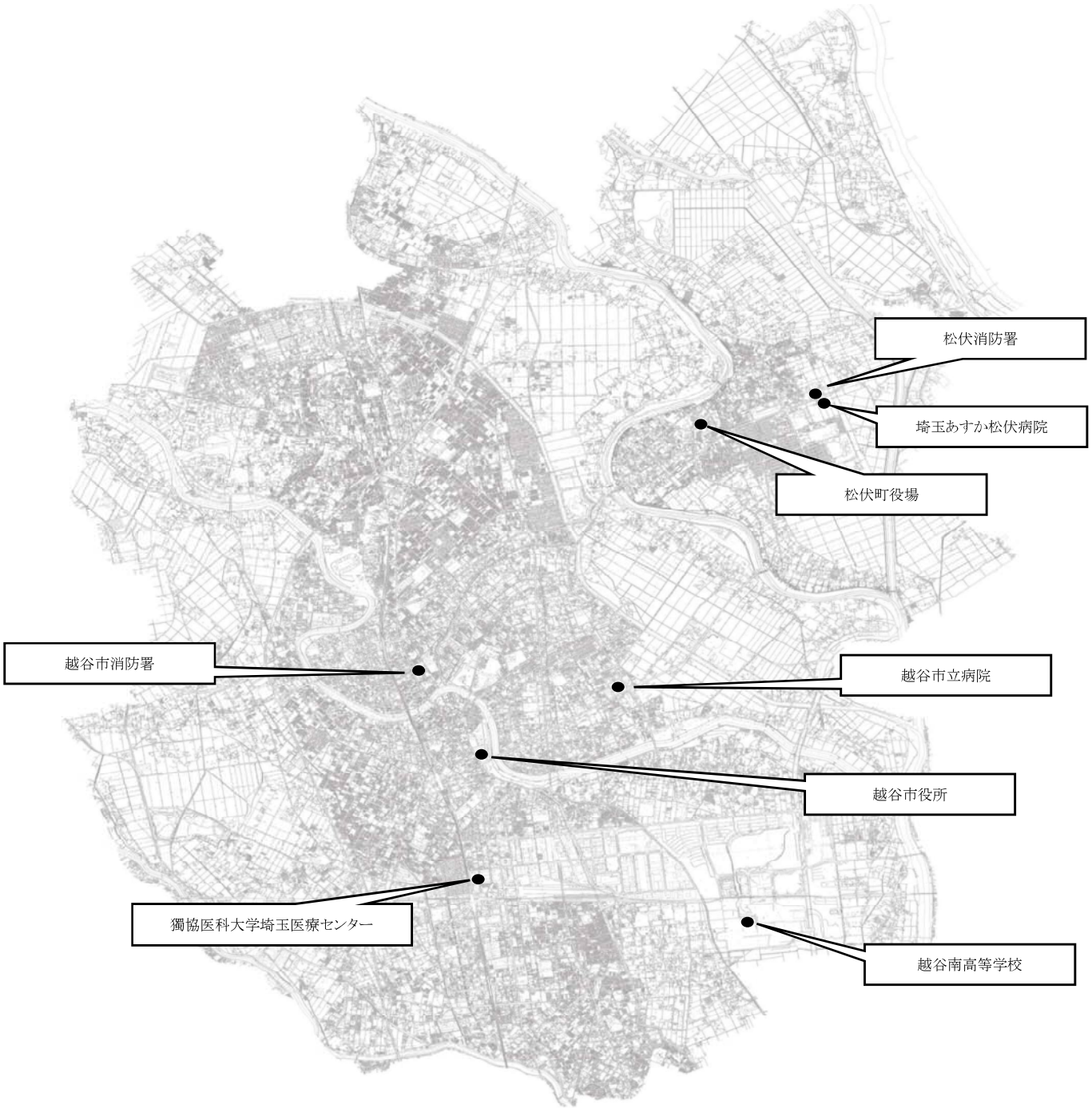
図-1 下水道事業に関する重要施設位置図